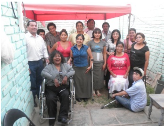
Deelnemers van de vakopleiding.

Dankzij een donatie van een Peruaanse organisatie (CEAS) aan EMSOLAM konden de 14 deelnemers van de tweede vakopleiding orthopedische hulpmiddelen direct daarop aansluitend nog een korte vervolgcursus krijgen. In die vervolgcursus stond het maken van krukken en orthopedische zolen centraal.