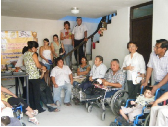
Feestelijke opening leerwerkplaats Ferreñafe.