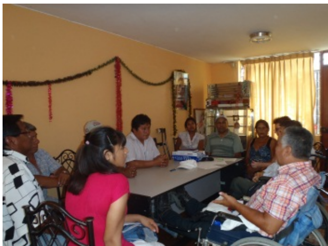
Vorbereidingsbijeenkomst met deelnemers van de 3 leerwerkplaatsen.

Namens EMSOLAM hartelijk dank aan alle donateurs!