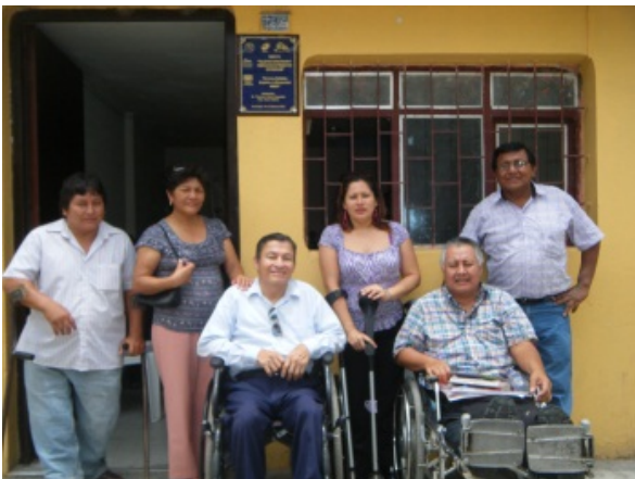
EMSOLAM en deelnemers van de leerwerkplaats in Ferreñafe.