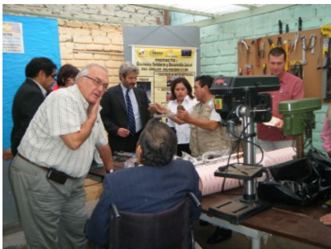
Ambassadeur krijgt uitleg over de vervaardigde orthopedische hulpmiddelen.