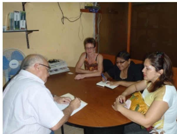
Bespreking over bruikleenovereenkomst lokaal Cayalti.

Na 1 jaar lobbyen en onderhandelen sluit de overheidsinstelling Fiducia met EMSOLAM op 10 januari 2012 een bruikleenovereenkomst af ten behoeve van een lokaal voor de leerwerkplaats in Cayalti. De oplevering van het lokaal vindt plaats in april.