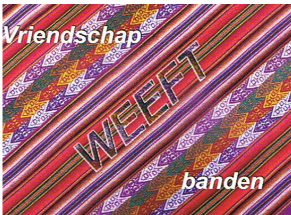
Sponsorkaart Onbegrensd Ondernemen.

Binnenkort volgen nog meer plaatsingen. De tentoonstelling is voor uitlening beschikbaar. Wij vragen géén huur, maar vervoer en verzekering zijn voor kosten van de huurder. Bij de tentoonstelling zijn sponsorkaarten beschikbaar. Heeft u belangstelling voor het plaatsen van deze fototentoonstelling? Stuur ons dan uw verzoek per email.