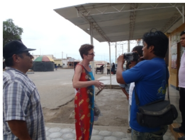
Interview bij lokaal tv-station in Cayalti.

Ondertussen wordt in Cayalti door deelnemers van de leerwerkplaats en Onbegrensd Ondernemen bij het lokale tv-station aandacht gevraagd voor de toekomstige leerwerkplaats.