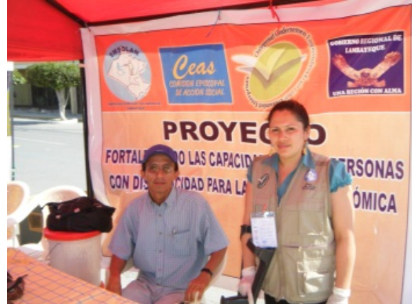
Promotie orthopedische producten op de feria.

In december 2011 maakten enkele deelnemers van de vakopleiding promotie voor hun orthopedische producten op een feria solidaria: een regionale markt voor eerlijke handel in Chiclayo.