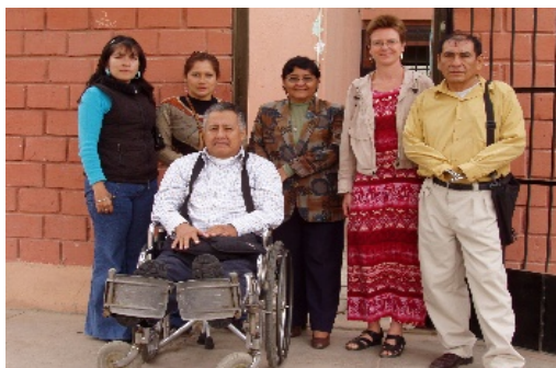
Bestuursleden van EMSOLAM

De eerste activiteit van deze vereniging is een themabijeenkomst op 10 oktober. Ze verwachten 50 aankomende ondernemers met een lichamelijke handicap. Het is een interactieve bijeenkomst met thema's als vernieuwend ondernemerschap, succesvol ondernemen en een toelichting op de wet m.b.t. de rechten van mensen met een handicap.