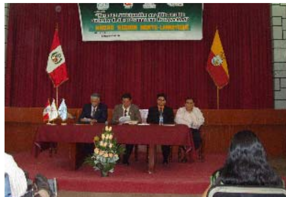
Ondertekenen van de intentieverklaring

zelforganisaties voor gehandicapten die er naar streven gesprekspartner te zijn en lobbyen op overheidsniveau voor het naleven van de rechten van gehandicapten