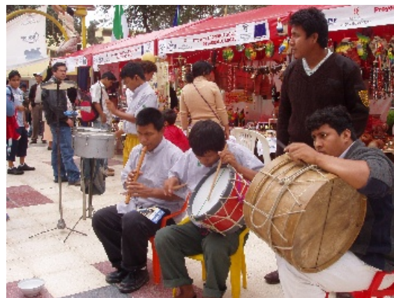
Blinde muzikanten op de fair-trade markt

Onbegrensd Ondernemen heeft er voor gezorgd dat ambachtslieden met een handicap deel konden nemen aan de regionale fair trade markt die eind juni plaats vond in Chiclayo – regio Lambayeque, georganiseerd door Grupo de Iniciativa Economía Solidaria (GIES) . De ambachtslieden verkochten hun producten als keramiek, sandalen, sierraden en kleding zonder tussenkomst van tussenhandelaren.